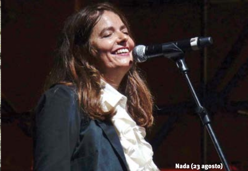
Nada (23 agosto)