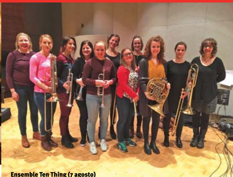
Ensemble Ten Thing (7 agosto)

del Gruppo Folkloristico Città di Genova. Infine, alle 21 si esibiscono i Maghi di CarrOZ, gruppo folk-rock a metà fra Irlanda e Liguria