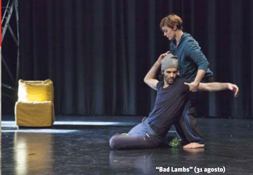
"Bad Lambs" (31 agosto)