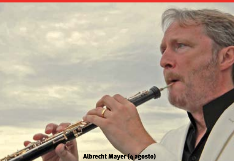
Albrecht Mayer (4 agosto)

Olivier Messiaen (1908-1992) fu compositore, pianista, organista e ornitologo francese. Arrestato dai tedeschi nel 1940, compose, durante la detenzione nel campo di lavoro di Görlitz, una delle sue opere da camera più famose, il "Quatuor pour la fin du temps", per clarinetto, violino, violoncello e pianoforte; accanto all'angoscia per la difficile condizione di prigionia, scaturisce dall'opera la religiosità che pervade il pensiero dell'autore, e la ricerca del superamento del "tempo musicale" classicamente inteso, attraverso metri e ritmi estremamente complessi. Obbligatoria la prenotazione.