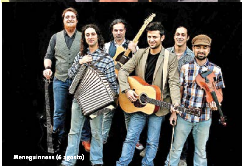
Meneguiness (6 agosto)