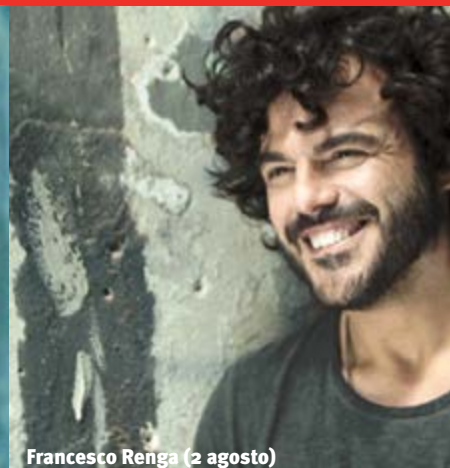
Francesco Renga (2 agosto)

di Paolo Virzì, con Valeria Bruni Tedeschi, Micaela Ramazzotti,