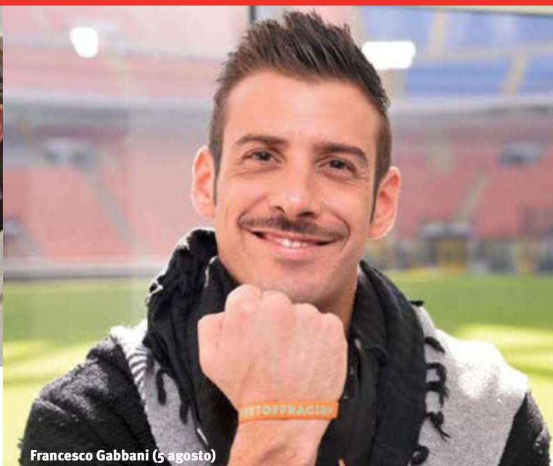
Francesco Gabbani (5 agosto)

Per "Itinerari Folk". Trento, Cortile Crispi-Bonporti ore 21.30. Quintetto di musica tradizionale del Québec canadese.