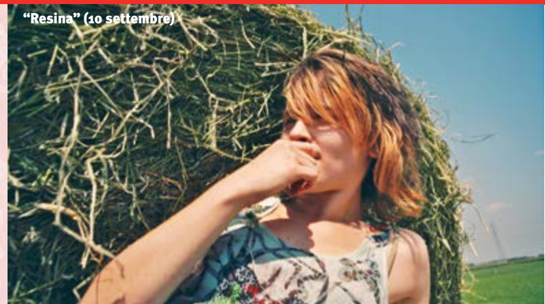
“Resina” (10 settembre)

Il film, che viene proiettato alla presenza del regista, studia l’im-