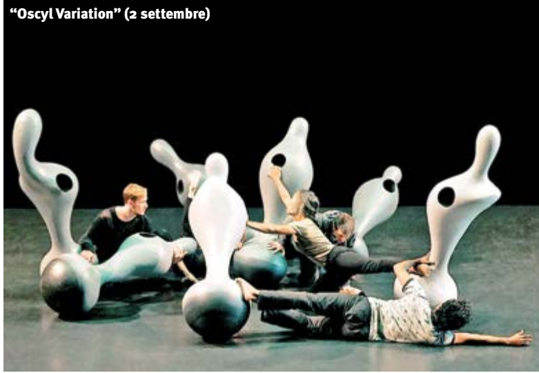
"Oscyl Variation" (2 settembre)

Musiche di Brahms, Rachmaninoff, Piazzolla e Gershwin. Pergine, Castello, ore 17.30.