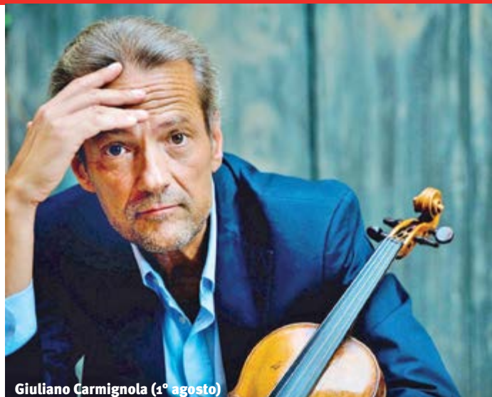
Giuliano Carmignola (1° agosto)

con Gherardo Colombo. Lavarone, Centro Congressi, ore 21.15.