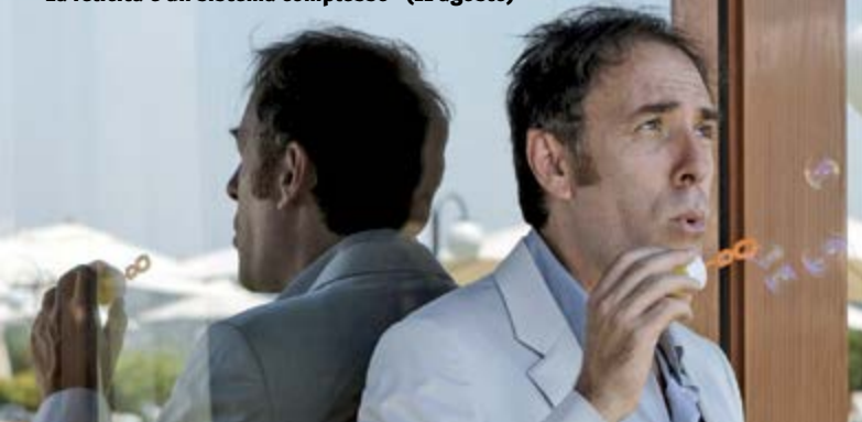
"La felicità è un sistema complesso" (11 agosto)