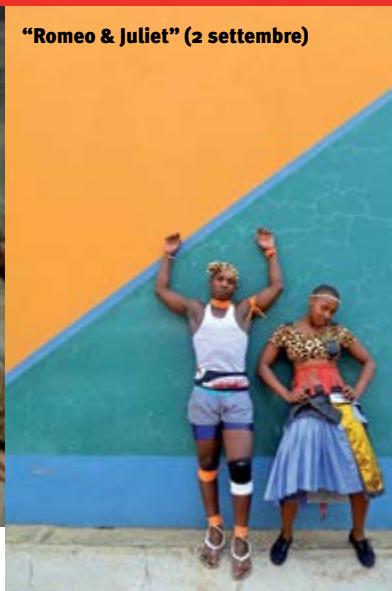
"Romeo & Juliet" (2 settembre)