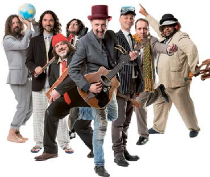
Bandabardò (4 agosto)