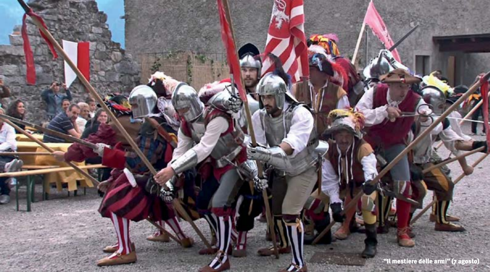
"Il mestiere delle armi" (7 agosto)