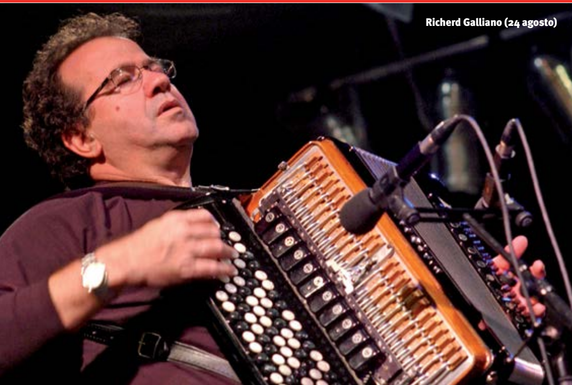
Richard Galliano (24 agosto)