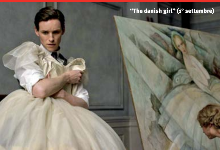
"The danish girl" (1° settembre)