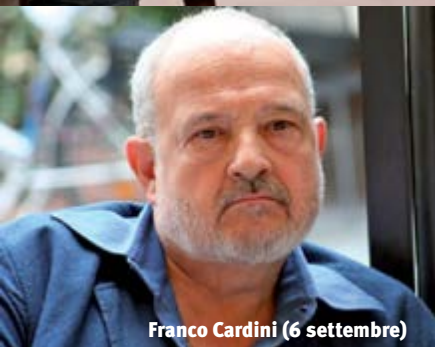
Franco Cardini (6 settembre)