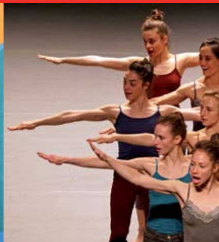
Teatro/Musica "ARMONICAMENTE DAL FRONTE"