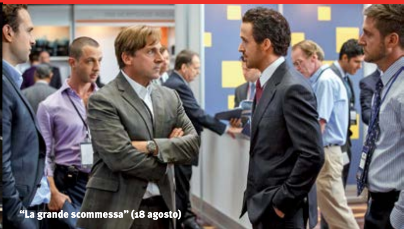
"La grande scommessa" (18 agosto)

L'esperienza di Arte Sella attraverso le voci dei suoi protagonisti.