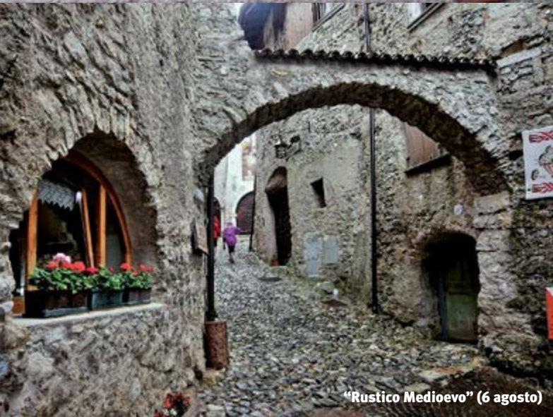
"Rustico Medioevo" (6 agosto)