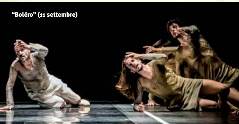
"Boléro" (11 settembre)