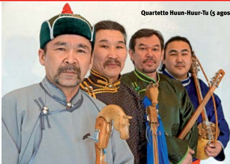
Quartetto Huun-Huur-Tu (5 agosto)

Nato nel 1953 nella fu Jugoslavia, trasferitosi con la famiglia in Trentino a 6 anni e laureatosi in Medicina, fu scoperto negli anni '70 da Francesco De Gregori e raggiunse un grande successo nel '78 con la canzone "Stasera l'aria è fresca". Ha quindi seguito fino ad oggi, anche se sotto tono, una onorata carriera di cantautore.