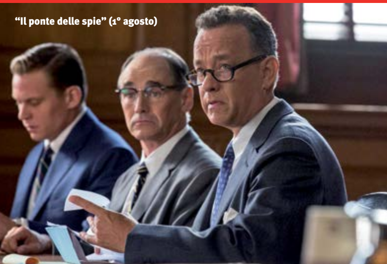
"Il ponte delle spie" (1° agosto)