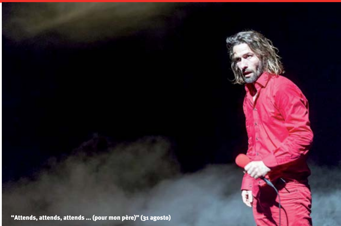
"Attends, attends, attends ... (pour mon père)" (31 agosto)