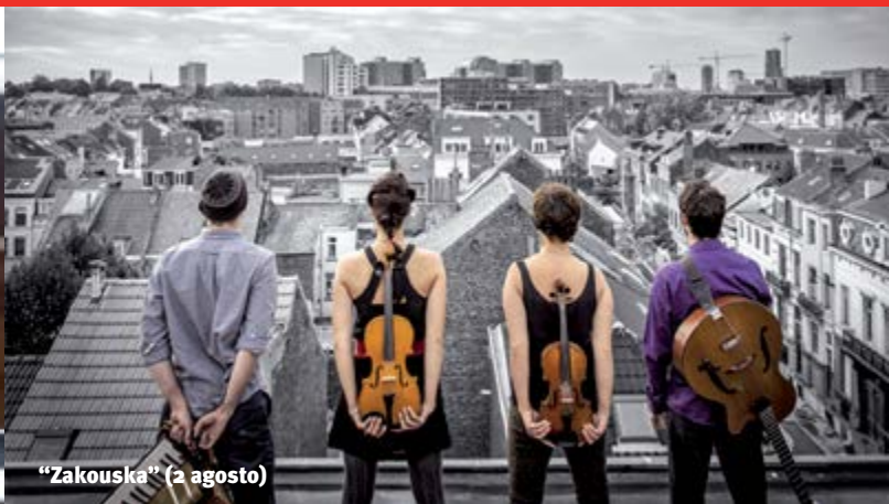
"Zakouska" (2 agosto)