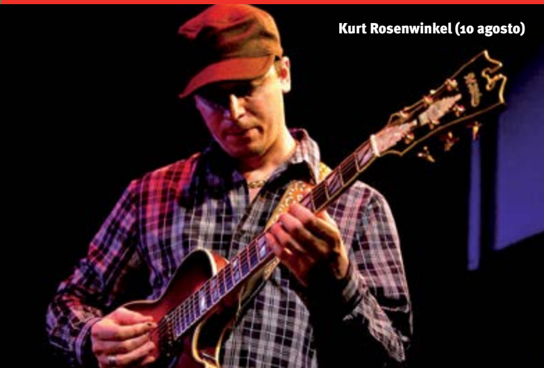
Kurt Rosenwinkel (10 agosto)